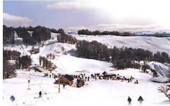
San Martín de los Andes

Turismo: si bien muestra un grado de desarrollo importante en varios de los corredores turísticos, todavía presenta una gran cantidad de oportunidades en circuitos que están subdesarrollados en cuanto a los servicios y la infraestructura que presentan. Existe un importante número de proyectos identificados en localizaciones turísticas para los cuales la Provincia tiene particular interés en que se desarrollen, por lo cual se establecen diversos